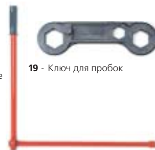
19 - Ключ для пробки