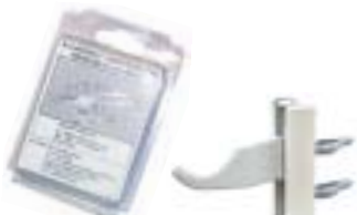
27 - Кронштейны универсальные белые Blister (пара)