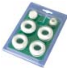
43 - Комплект монтажный на 3/8" с силиконовыми прокладками для радиаторов высотой от 200/D до 800 мм