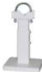
15 - Кронштейн напольный белый