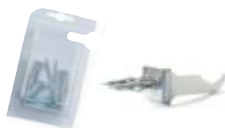
29 - Кронштейны угловые белые Blister (пара)