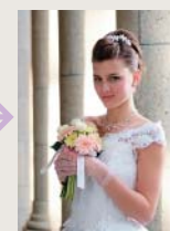
Оптимизированное изображение после обработки