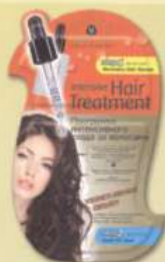
SL720 Маска «УКРЕПЛЕНИЕ И ОБЪЕМ»

Создана специально для ухода за истонченными, сухими волосами, подвергшимися окраске, химической завивке или агрессивному воздействию солнечных лучей. Восстанавливает внутреннюю поврежденную структуру волос, наполняет их здоровьем и блеском.