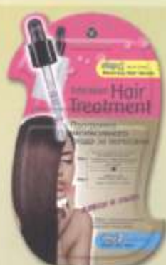
SL721 Маска «БЛЕСК И СИЛА»

Маска предназначена для быстрого восстановления и укрепления истонченных, ослабленных и секущихся волос. Маска придает пышность и обеспечивает необходимое питание волосам. Защищает волосы от повреждений при использовании фена или щипцов.