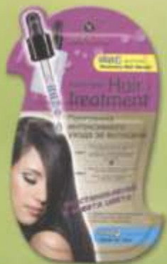
SL722 Маска «ВОССТАНОВЛЕНИЕ И ЗАЩИТА ЦВЕТА»

Маска для волос «БЛЕСК И СИЛА» «УВЛАЖНЕНИЕ И ПИТАНИЕ» «ВОССТАНОВЛЕНИЕ И ЗАЩИТА ЦВЕТА» «УКРЕПЛЕНИЕ И ОБЪЕМ» «ПИТАНИЕ И ВОССТАНОВЛЕНИЕ»