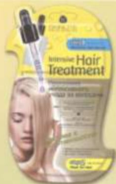
SL719 Маска «ПИТАНИЕ И ВОССТАНОВЛЕНИЕ»

Создана специально для ухода за истонченными, сухими волосами, подвергшимися окраске, химической завивке или агрессивному воздействию солнечных лучей. Восстанавливает внутреннюю поврежденную структуру волос, наполняет их здоровьем и блеском.