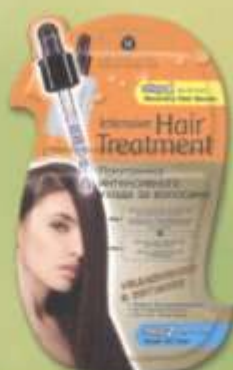
SL723 Маска «УВЛАЖНЕНИЕ И ПИТАНИЕ»

Маска для быстрого и интенсивного восстановления волос, подвергшихся окраске, химической завивке или агрессивному воздействию солнечных лучей. Интенсивно восстанавливает поврежденную структуру волос, придает эластичность и сияющий блеск.