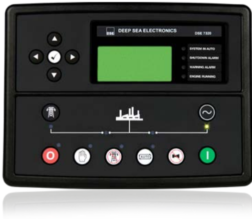
Deep Sea Electronics PLC серия DSEgenset® модель DSE 7320

DSE 7320 — новый управляющий контроллер Английской компании Deep Sea Electronics для работы с одной генераторной установкой, с возможностью слежения за сетью (AMF).