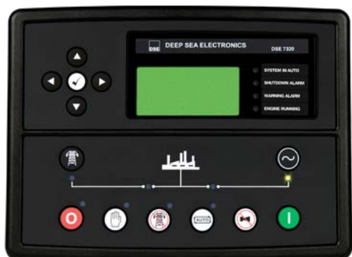
Deep Sea Electronics PLC серия DSEgenset® модель DSE 7320

DSE 7320 — новый управляющий контроллер Английской компании Deep Sea Electronics для работы с одной генераторной установкой, с возможностью слежения за сетью (AMF).