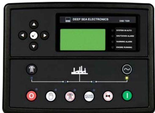
Deep Sea Electronics PLC серия DSEgenset® модель DSE 7320

DSE 7320 — новый управляющий контроллер Английской компании Deep Sea Electronics для работы с одной генераторной установкой, с возможностью слежения за сетью (AMF).