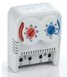
Термостат на DIN рейку (НО+НЗ контакт)