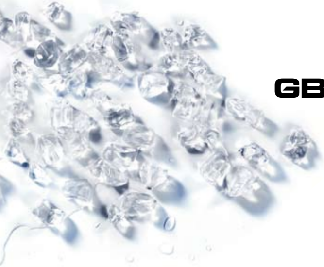
Granismart 1 - 1/TS