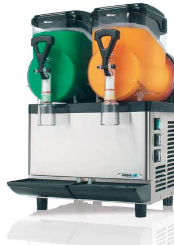
Granismart 2 - 2/TS

Являющийся единственным во всей отрасли благодаря высокой технологии, защищённой патентом «GBG», ГРАНИСМАРТ представляет собой самый маленький гранитор в мире. Он идеален для небольших помещений и для охлаждения небольшого количества граниты, сорбета и прохладительных напитков. Практичный и легкий в эксплуатации (он меньше на 30% по сравнению с традиционными машинами), ГРАНИСМАРТ в то же время является профессиональным и надёжным прибором, который особенно подходит для производства новых напитков на основе кофе и десертов, содержащих жиры, требующих более частого приготовления для сохранения их свежести.