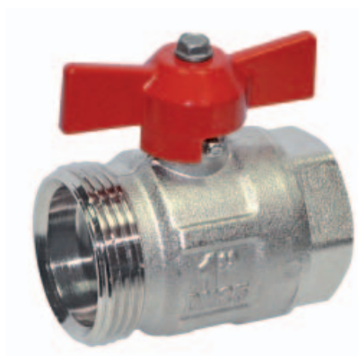
Шаровой кран «бабочка»