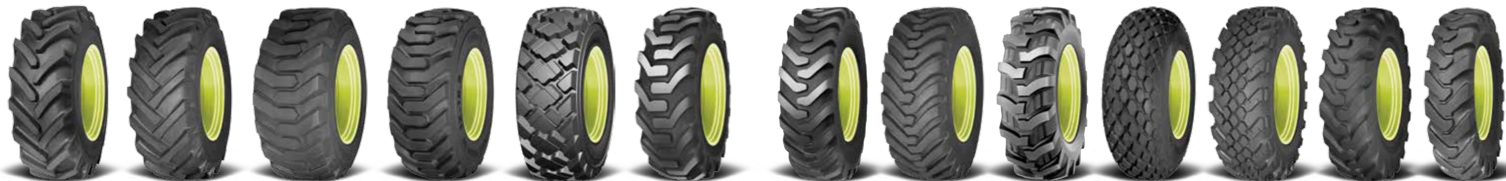
Agro Industrial 10 Agro Industrial 20 Skid Steer 20 Skid Steer 30 Skid Steer 50 Industrial 10 Industrial 20 Industrial 30 Industrial 40 Industrial 50 MPT 30 Earthmover 10 Earthmover 20