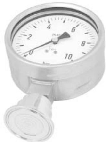
Разделитель, Клемповое присоединение Модель 990.52 с манометром Модели 232.50 HP 100

FDA - Управление по санитарному надзору за пищевыми продуктами и медикаментами