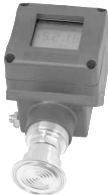
Разделитель, Три-клемповое присоединение Модель 990.22 с преобразователем UT-10