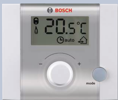
Комнатный регулятор FR 10 с ЖК-дисплеем обеспечит Вам полный контроль над системой отопления.

Данная серия регуляторов может быть встроена в котел, а может быть установлена в жилом помещении. Желательно, на самую холодную стену дома устанавливается датчик наружной температуры. Постарайтесь установить его так, чтобы избежать прямого попадания на него солнечных лучей, тепловых потоков из открытых форточек или дымовых газов из дымохода, выведенного на фасад. Далее на погодозависимом регуляторе выполняется настройка отопительной кривой и ее более точная подстройка спустя некоторое время. При этом регулятор хранит в своей памяти данные о прошедшей работе, накапливая тем самым практическую информацию о предпочтениях клиента и подстраиваясь под заданный режим работы.