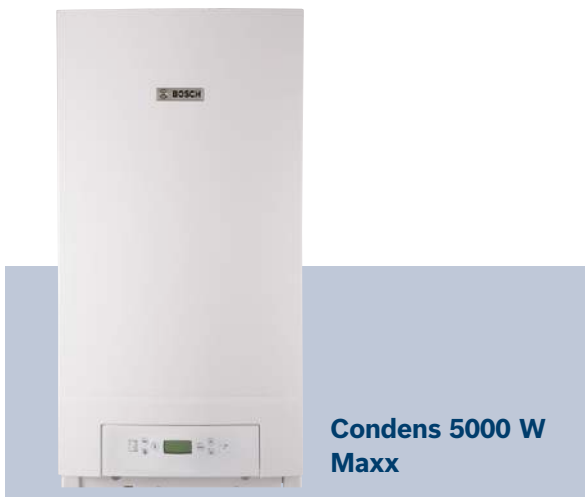
Condens 5000 W Maxx

Поставляется в двух моделях мощностью 65 и 98 кВт. Для достижения большей мощности есть возможность использовать в каскаде.