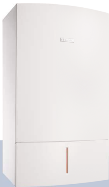
Condens 7000 W

Condens 7000 W работает чрезвычайно тихо и одновременно предлагает максимальный комфорт отопления и горячего водоснабжения на базе самой современной конденсационной техники. Отсюда - ценное свойство этого котла: Вы можете спокойно отдыхать дома и всегда ощущать эффект экономии энергии.