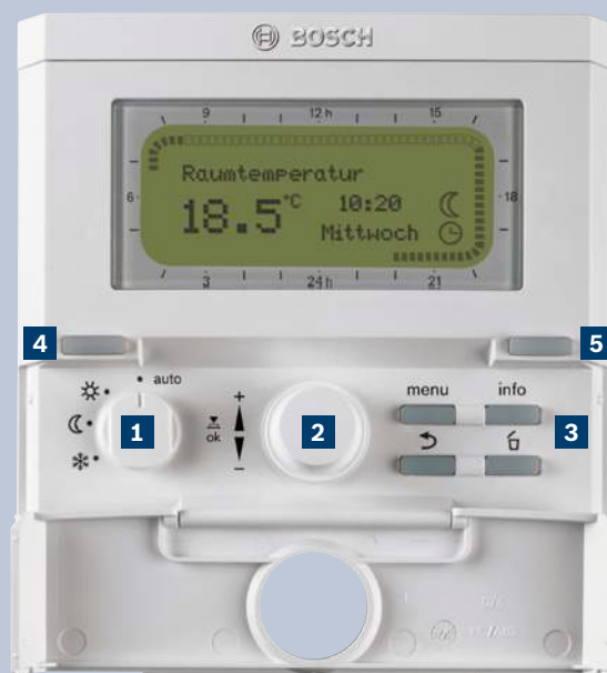
Погодозависимый контроллер FW200.