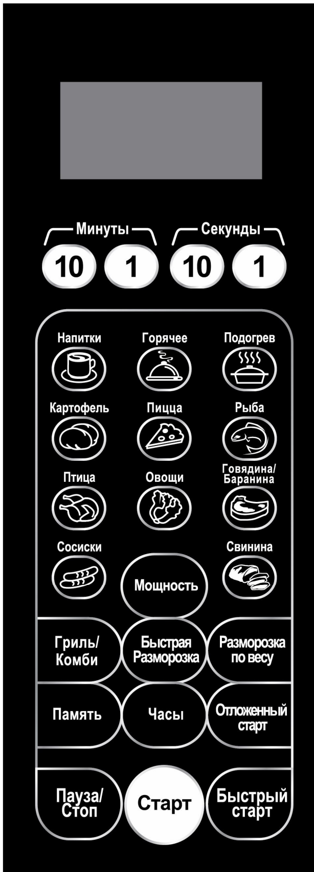
Рис.2. Панель управления оборудования