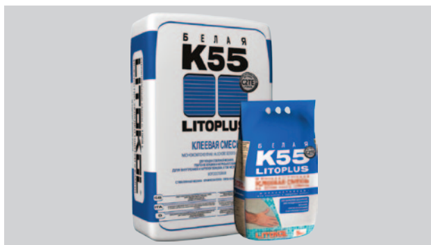
Мешки 25 кг трехслойные, из двух слоев бумаги с промежуточным слоем из полиэтиленовой пленки. Мешки 5 кг из металлизированной пленки.

Изготовитель оставляет за собой право совершенствовать состав продукции, вследствие чего некоторые её свойства могут значительно отличаться от вышеуказанных. Изготовитель сохраняет за собой право вносить изменения в данное техническое описание, связанные с совершенствованием технологий. С выпуском настоящего технического описания все предыдущие становятся недействительными. Изготовитель не несёт ответственности за неправильное использование материала, а также за его применение в целях и условиях, не предусмотренных инструкцией. Работы необходимо выполнять в соответствии со строительными нормами и правилами (СНиП). Инструкция не заменяет профессиональной подготовки исполнителя. В каждом конкретном случае применения материалов LITOKOL , имеющего отклонения от инструкции, требуется опытная проверка потребителем, так как вне влияния производителя остаётся ряд факторов, особенно если одновременно используются материалы других фирм. Инструкция производителя содержит данные и рекомендации, основанные на собственном опыте и проведённых исследованиях, и не учитывает какие-либо специфические условия. Инструкция носит рекомендательный характер и не может являться основанием для предъявления претензий имущественного характера. Если у Вас возникнет необходимость в консультации относительно применения продукции LITOKOL , обращайтесь, пожалуйста, в сервисную консультационную службу LITOKOL .