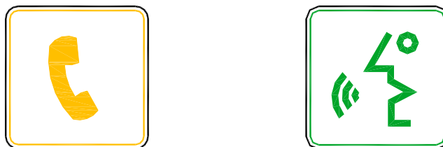
Рис. 3. Изображение желтой и зеленой пиктограмм

Желтая пиктограмма загорается в момент нажатия аварийной кнопки вызова персонала. Зеленая пиктограмма загорается в момент включения переговорной связи диспетчера с кабиной лифта.