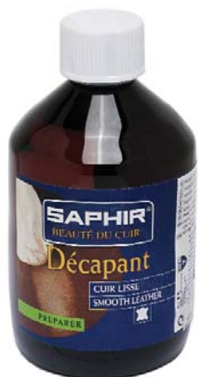
DECAPANT Арт. 0848, флакон 500 мл., бесцв.

Применение: Перед использованием взболтать, нанести средство губкой или мягкой тканью на обрабатываемую поверхность и протирать до исчезновения пятен, загрязнений. Через несколько минут поверхность приобретает свой цвет и мягкость.