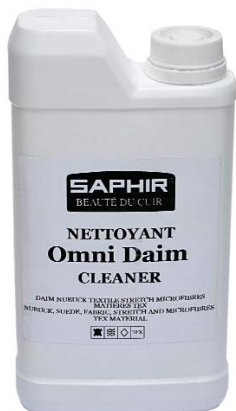
OMNI DAIM Арт. 0218, флакон 500 мл, бесцв.

Очиститель для глубокой и мягкой чистки изделий из всех видов замши, нубука, велюра, синтетических, текстильных и материалов «стретч». Возвращает первоначальный вид даже очень загрязненным изделиям, удаляет пятна и разводы. Освежает цвет.