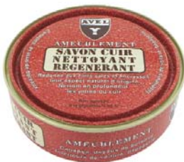
SAVON NETTOYANT Арт.4001, 200мл., банка, бесцветн.

Очиститель-мыло предназначен для мягкой чистки и восстановления внешнего вида изделий из всех видов гладких кож. Входящий в состав глицерин смягчает и питает кожу.