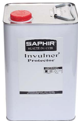
INVULNER PROTECTOR Арт. 0779, канистра 5л., бесцв.