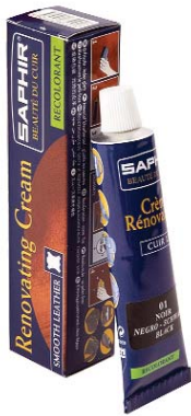
RENOVATING CREAM Арт.0851, туба 25мл, 48 цветов

Крем восстановитель («жидкая кожа») используется для восстановления поврежденного лицевого слоя всех видов гладких кож. Применяется для обработки только поврежденных участков кожи. Наносить тонкими слоями на поврежденную поверхность с помощью ткани или губки, дать высохнуть 10 мин. После обработки рекомендуется нанести защитные средства в зависимости от вида кожи (крема, воски, бальзамы и др.), при сильных повреждениях рекомендуется наносить 2-3 слоя.