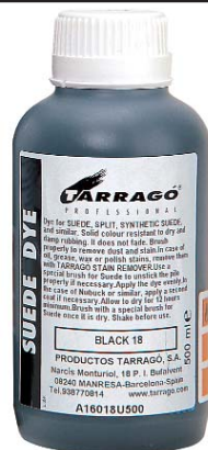
SUEDE DYE Арт. TPP16, флакон 500 мл. черный, т. коричневый, т. синий