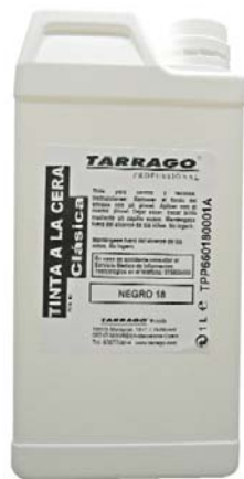
CLASSIC WAX INK Арт. TPP66, фляжка 1000мл, черный, т. коричневый