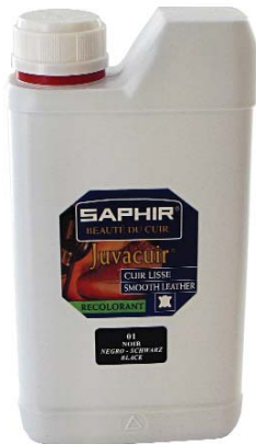
JUVACUIR Арт.0804, флакон 500 мл. Черный, т. коричневый

Крем восстановитель («жидкая кожа») используется для восстановления поврежденного лицевого слоя всех видов гладких кож. Применяется для обработки только поврежденных участков кожи. Наносить тонкими слоями на поврежденную поверхность с помощью ткани или губки, дать высохнуть 10 мин. После обработки рекомендуется нанести защитные средства в зависимости от вида кожи (крема, воски, бальзамы и др.), при сильных повреждениях рекомендуется наносить 2-3 слоя.