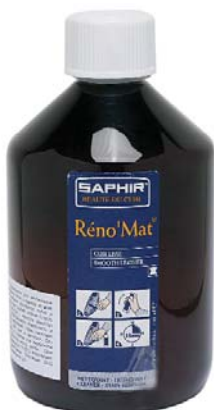
RENOMAT Арт. 0518, флакон 500 мл, бесцв.

Применение: Окунуть щетку в чистящий состав, потереть обрабатываемую поверхность, до образования пены, затем удалить пену с помощью промытой щетки или ткани. После высыхания замшу и нубук рекомендуется обработать спец. щеткой или губкой для придания бархатистости.