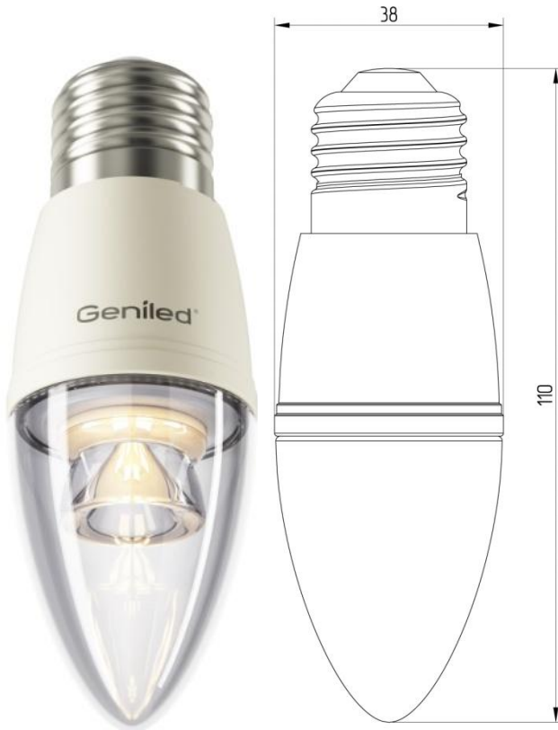
Рисунок 1 – Внешний вид.

Светодиодная лампа Geniled E27 C37 8W - со светодиодами повышенной яркости NationStar SMD 3528. Эффективный теплоотвод достигается за счет плотного соединения светодиодной платы с алюминиевым радиатором, который покрыт термопроводящим пластиком. Колба лампы выполнена из ударопрочного прозрачного поликарбоната. Лампа используется в светильниках и бра с цоколем E27 в качестве замены традиционных ламп типа «свеча».