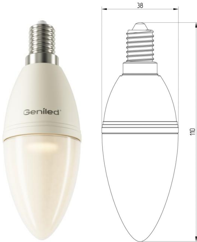
Рисунок 1 – Внешний вид.

Светодиодная лампа Geniled E14 C37 5W - со светодиодами повышенной яркости NationStar SMD 3528. Эффективный теплоотвод достигается за счет плотного соединения светодиодной платы с алюминиевым радиатором, который покрыт термопроводящим пластиком. Колба лампы выполнена из ударопрочного матового поликарбоната. Лампа используется в светильниках и бра с цоколем E14 в качестве замены традиционных ламп типа «свеча».