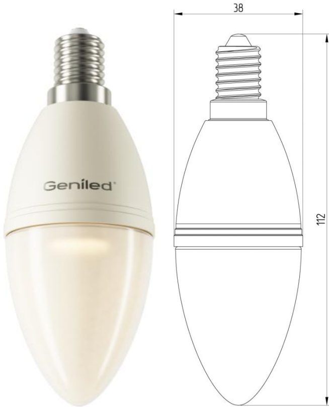
Рисунок 1 – Внешний вид.

Светодиодная лампа Geniled E14 C37 7W - со светодиодами повышенной яркости NationStar SMD 3528. Эффективный теплоотвод достигается за счет плотного соединения светодиодной платы с алюминиевым радиатором, который покрыт термопроводящим пластиком. Колба лампы выполнена из ударопрочного матового поликарбоната. Лампа используется в светильниках и бра с цоколем E14 в качестве замены традиционных ламп типа «свеча».