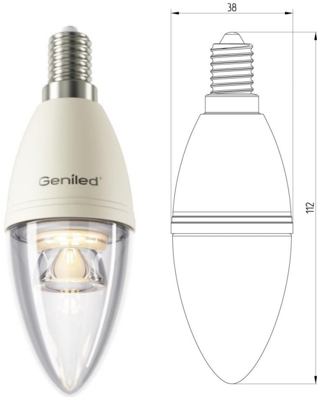
Рисунок 1 – Внешний вид.

Светодиодная лампа Geniled E14 C37 8W - со светодиодами повышенной яркости NationStar SMD 3528. Эффективный теплоотвод достигается за счет плотного соединения светодиодной платы с алюминиевым радиатором, который покрыт термопроводящим пластиком. Колба лампы выполнена из ударопрочного прозрачного поликарбоната. Лампа используется в светильниках и бра с цоколем E14 в качестве замены традиционных ламп типа «свеча».