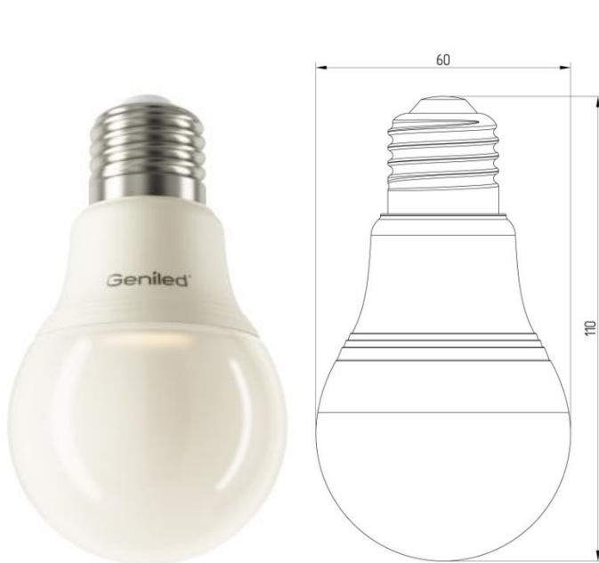
Рисунок 1 – Внешний вид.

Светодиодная лампа Geniled E27 A60 7W - со светодиодами повышенной яркости NationStar SMD 3528. Эффективный теплоотвод достигается за счет плотного соединения светодиодной платы с алюминиевым радиатором, который покрыт термопроводящим пластиком. Колба лампы выполнена из ударопрочного матового поликарбоната. Лампа используется в светильниках и бра с цоколем E27 в качестве замены традиционных ламп типа «груша».