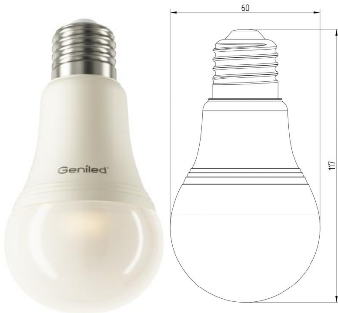
Рисунок 1 – Внешний вид.

Светодиодная лампа Geniled E27 A60 12W - со светодиодами повышенной яркости NationStar SMD 3528. Эффективный теплоотвод достигается за счет плотного соединения светодиодной платы с алюминиевым радиатором, который покрыт термопроводящим пластиком. Колба лампы выполнена из ударопрочного матового поликарбоната. Лампа используется в светильниках и бра с цоколем E27 в качестве замены традиционных ламп типа «груша».