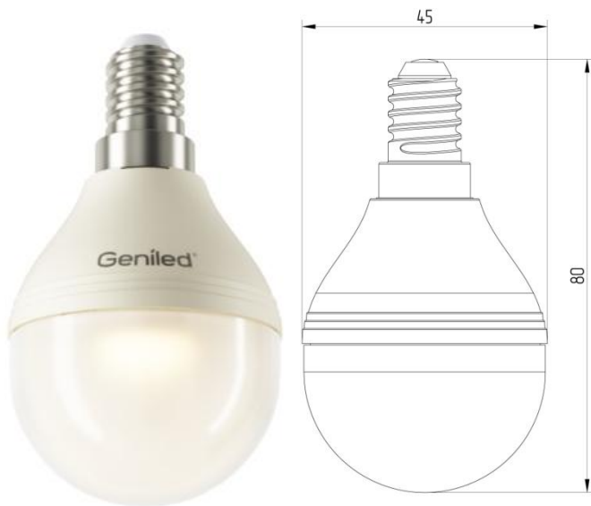
Рисунок 1 – Внешний вид.

Светодиодная лампа Geniled E14 G45 5W - со светодиодами повышенной яркости NationStar SMD 3528. Эффективный теплоотвод достигается за счет плотного соединения светодиодной платы с алюминиевым радиатором, который покрыт термопроводящим пластиком. Колба лампы выполнена из ударопрочного матового поликарбоната. Лампа используется в светильниках и бра с цоколем E14 в качестве замены традиционных ламп типа «шарик».