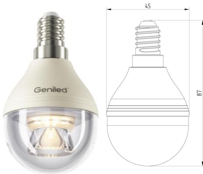
Рисунок 1 – Внешний вид.

Светодиодная лампа Geniled E14 G45 8W - со светодиодами повышенной яркости NationStar SMD 3528. Эффективный теплоотвод достигается за счет плотного соединения светодиодной платы с алюминиевым радиатором, который покрыт термопроводящим пластиком. Колба лампы выполнена из ударопрочного прозрачного поликарбоната. Лампа используется в светильниках и бра с цоколем E14 в качестве замены традиционных ламп типа «шарик».