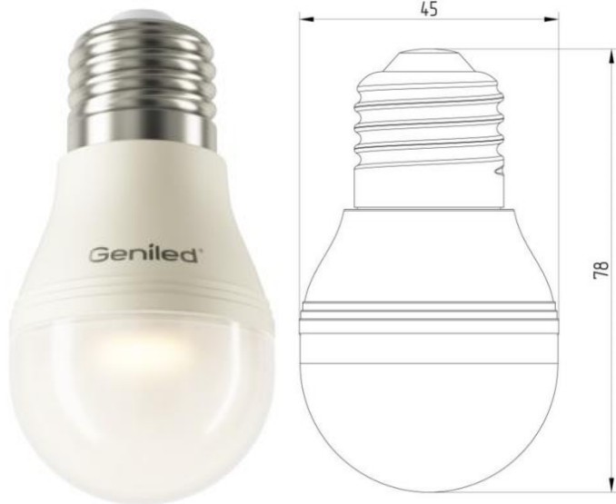
Рисунок 1 – Внешний вид.

Светодиодная лампа Geniled E27 G45 5W - со светодиодами повышенной яркости NationStar SMD3528. Эффективный теплоотвод достигается за счет плотного соединения светодиодной платы с алюминиевым радиатором, который покрыт термопроводящим пластиком. Колба лампы выполнена из ударопрочного матового поликарбоната. Лампа используется в светильниках и бра с цоколем E27 в качестве замены традиционных ламп типа «шарик».