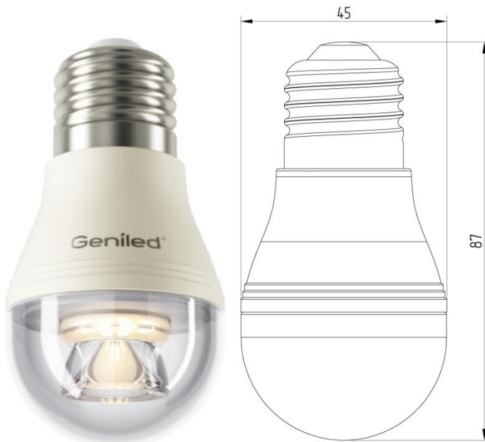
Рисунок 1 – Внешний вид.

Светодиодная лампа Geniled E27 G45 8W - со светодиодами повышенной яркости NationStar SMD 3528. Эффективный теплоотвод достигается за счет плотного соединения светодиодной платы с алюминиевым радиатором, который покрыт термопроводящим пластиком. Колба лампы выполнена из ударопрочного прозрачного поликарбоната. Лампа используется в светильниках и бра с цоколем E27 в качестве замены традиционных ламп типа «шарик».