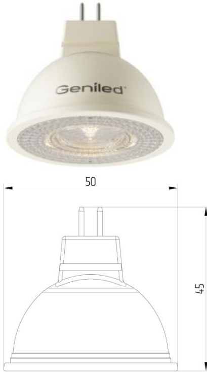
Рисунок 1 – Внешний вид.

Светодиодная лампа Geniled GU5.3 MR16 5W - со светодиодами повышенной яркости NationStar SMD 3528. Эффективный теплоотвод достигается за счет плотного соединения светодиодной платы с алюминиевым радиатором, который покрыт термопроводящим пластиком. Оптический рассеиватель лампы выполнен из ударопрочного прозрачного поликарбоната. Лампа используется в светильниках с цоколем GU5.3 в качестве замены традиционных ламп типа MR16.