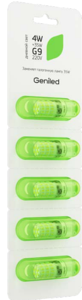
Рисунок 2 – Внешний вид упаковки.

Примечание: не пригодна для использования совместно со стандартными регуляторами уровня яркости.