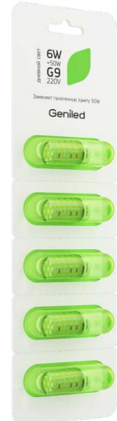
Рисунок 2 – Внешний вид упаковки.

Примечание: не пригодна для использования совместно со стандартными регуляторами уровня яркости.