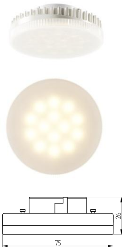
Рисунок 1 – Внешний вид.

Светодиодная лампа Geniled GX53 6W используется в накладных, встраиваемых светильниках в качестве замены люминесцентных ламп «таблеток» с цоколем GX53. Корпус выполнен из алюминия, пластика и матового поликарбоната.