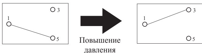
Рис. 2. Повышение давления

По достижении необходимой разности давлений между резервуарами контакты 1 и 3 размыкаются, а контакты 1 и 5 замыкаются, выключая насос.