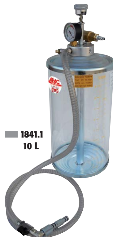
■ 1841.1 10 L