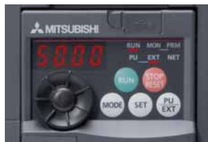
Встроенная панель управления с поворотным пультом управления

Благодаря встроенному поворотному пульту управления пользователь получает более быстрый непосредственный доступ ко всем важнейшим параметрам — по сравнению с традиционными кнопочными системами управления.