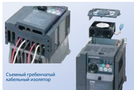
Съемный гребенчатый кабельный изолятор

Электромонтаж и замена вентилятора — без проблем