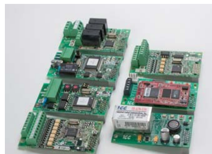
Опциональные платы для дополнительных функций.

Функциональность может быть расширена путем использования опциональных карт и дополнительных модулей ввода/вывода – в зависимости от конкретных случаев применения и индивидуальных запросов.