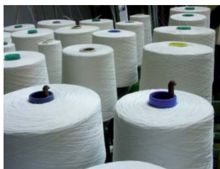
В текстильной промышленности без преобразователей частоты компании Mitsubishi тоже не обойтись.