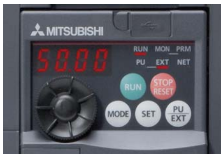
Встроенный поворотный пульт управления

Помимо ввода и индикации различных параметров, встроенный четырехразрядный жидкокристаллический дисплей используется также для контроля и вывода текущих эксплуатационных параметров и сообщений о сбоях и неисправностях.