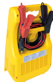
Гнездо для кабелей и зажимов.