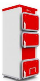
Q Hit 20 кВт