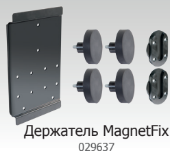
Держатель MagnetFix 029637