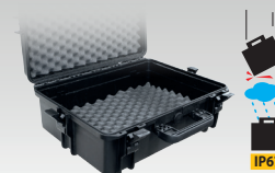
Кейс для транспортировки 060432