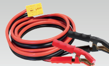
2 x 8 м - 16 мм 2 056572