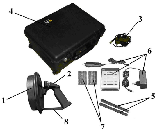
Рисунок 1 – Комплект изделия