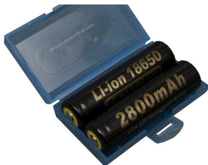
Рисунок 6 – Комплект аккумуляторов

5.4.2 Комплект зарядного устройства (ЗУ) представлен на рис. 7.