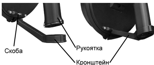
Рисунок 13 – Установка кронштейна

– закрепить кронштейн на скобе блока радиолокационного и рукоятке пульта (см. рисунок 13);