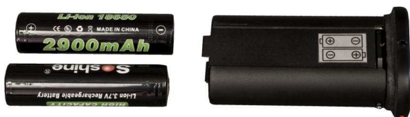
Рисунок 11 – Установка аккумуляторов

аккумуляторный отсек пульта управления, соблюдая полярность, указанную на стенке отсека (см. рисунок 11);