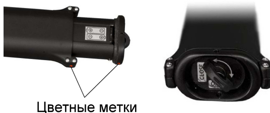
Рисунок 12 – Установка аккумуляторного отсека

– установить аккумуляторный отсек в рукоятку пульта, совместив цветные метки на аккумуляторной отсеке и рукоятке, зафиксировать аккумуляторный отсек в рукоятке с помощью запора (см. рисунок 12);