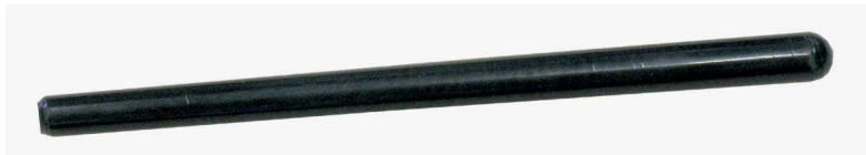
Рисунок 8 – Эквивалент объекта поиска

5.4.3 Эквивалент объекта поиска (рис. 8) служит для проверки работоспособности изделия. Он представляет собой пластиковый цилиндр, внутри которого находится полупроводниковый диод 2Д521А.