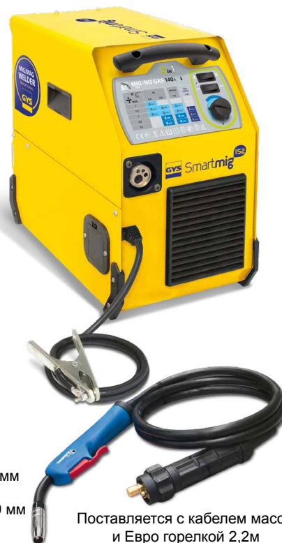
Поставляется с кабелем массы и Евро горелкой 2,2м

Вентилятор с постоянной скоростью защищает от перегрева.