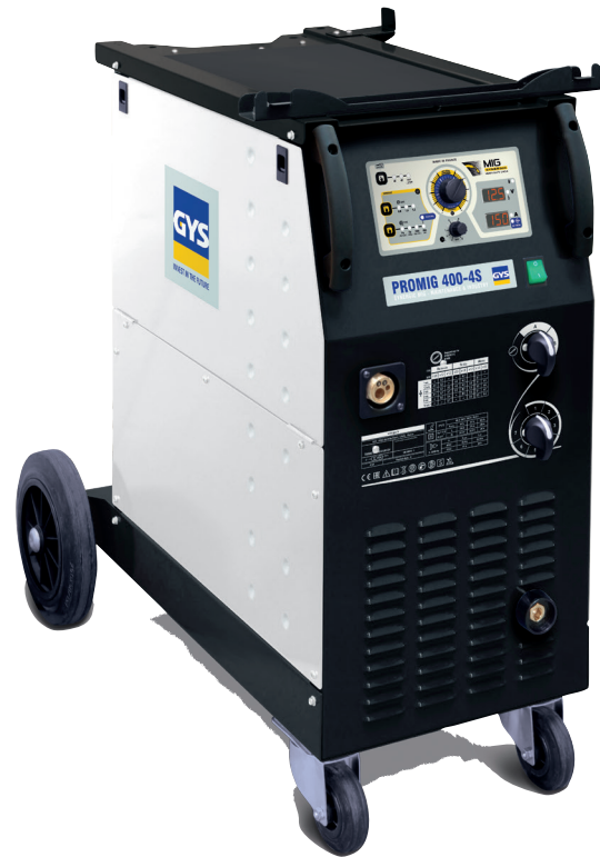
- Поставляется без аксессуаров (арт. 035898)