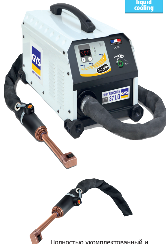
Полностью укомплектованный и смонтированный источник с 1 индуктором 90°.