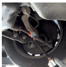
Раскрепления продольной рулевой тяги