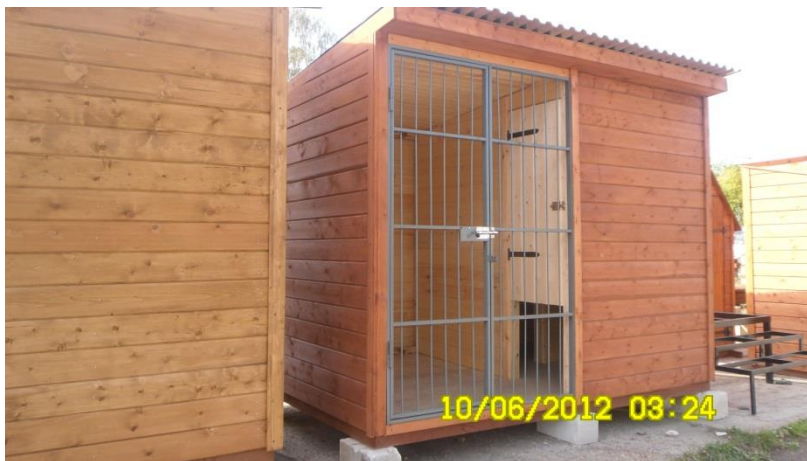
2. Вольер р-р 4000х2000 с площадкой под выгул