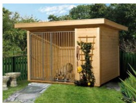
План-схема вольера с собачьей будкой внутри, р-р 3000 x 2000, арт. 252