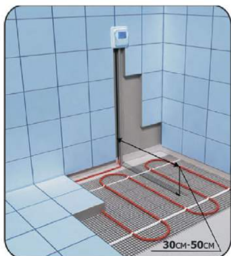
Схема укладки датчика температуры в гофрированной трубке

Установка датчика производится в штробу по полу и по стене. В целях защиты от механических повреждений, необходимо поместить датчик температуры в гофрированную трубу (входит в комплект). На полу штроба прокладывается между "витками" кабеля и должна быть такой длины, чтобы на 20-30 см заходить в зону, где будет лежать мат (рисунок 1). Важное условие - нельзя проводить гофру с датчиком под греющим кабелем; расположение датчика температуры должно находиться на равном расстоянии от соседних витков греющего кабеля.