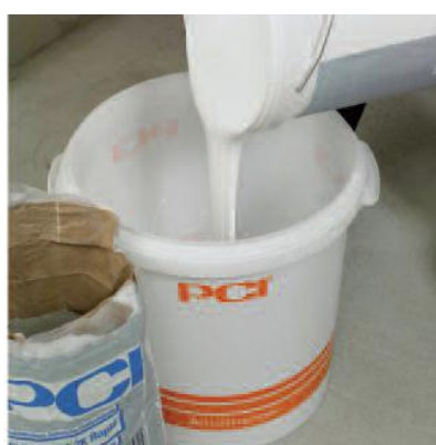
Добавить жидкий компонент PCI Seccoral 2K Rapid