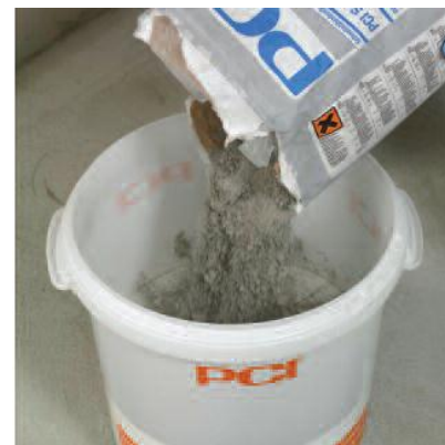
Засыпьте сухой компонент PCI Seccoral 2K Rapid в ёмкость