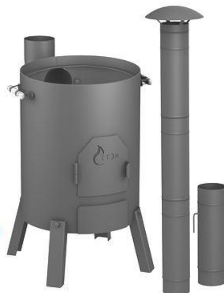
Фото 3. в базовой комплектации