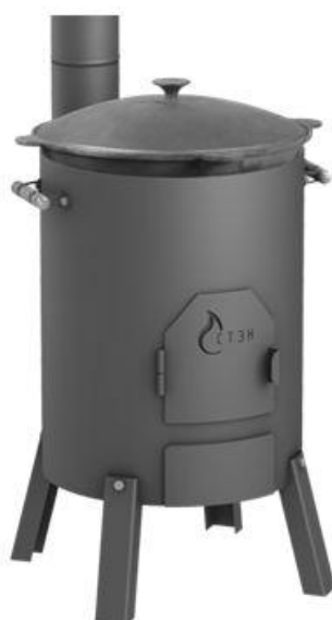
Фото 2. с 9-литровым казаном