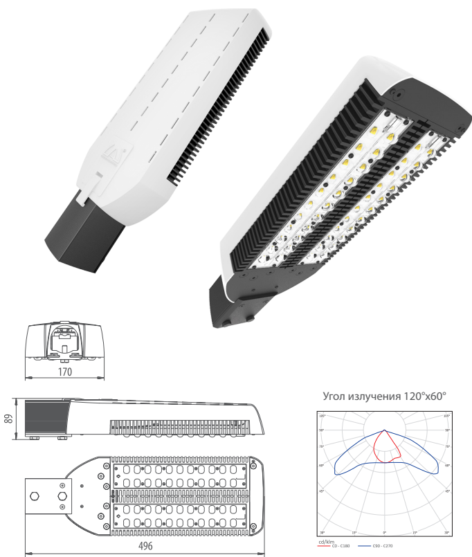
Угол излучения 120°x60°