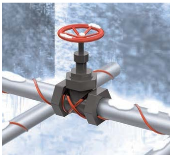
Огнестойкая полиолефиновая оболочка