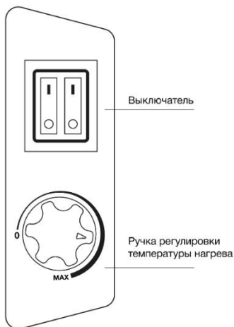
Рис. 4. Панель управления